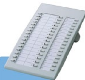
KX-T7740 Console DSS