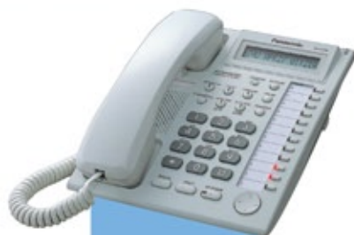
KX-T7730 Visor/ Viva-voz

Para um ajuste rápido do volume e do contraste do visor, bem como acesso a facilidades do sistema.